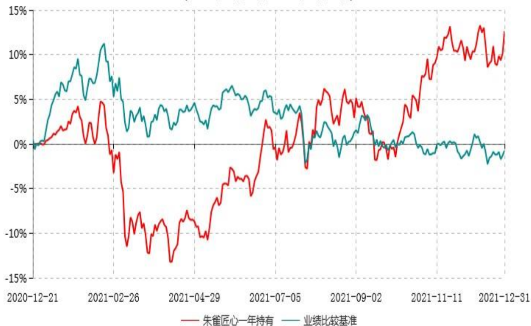
朱雀匠心一年持有期混合型证券投资基金累计净值增长率与业绩比较基准收益率历史走势对比图 (2020年12月21日-2021年12月31日)