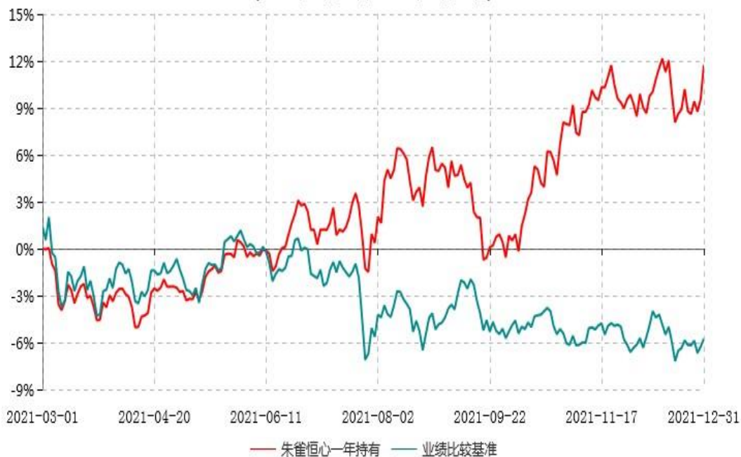
朱雀恒心一年持有期混合型证券投资基金累计净值增长率与业绩比较基准收益率历史走势对比图 (2021年03月01日-2021年12月31日)