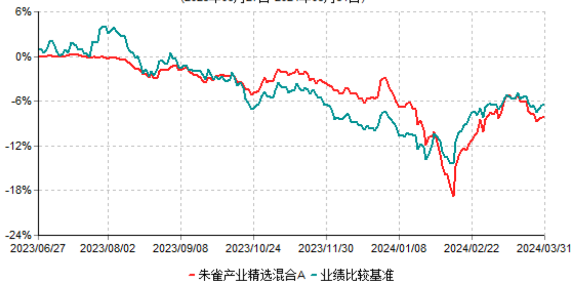
朱雀产业精选混合A累计净值增长率与业绩比较基准收益率历史走势对比图 (2023年06月27日-2024年03月31日)